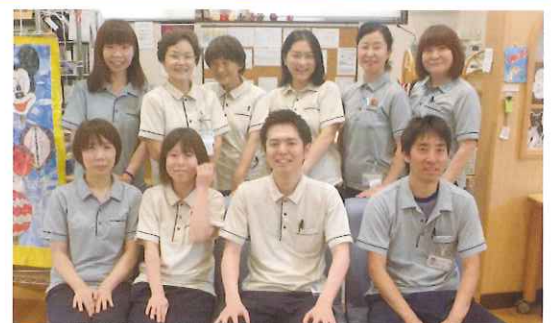
産休や育休も取得しやすく、社員旅行や忘年会も毎年楽しみにしています。

悩み事や相談事をしやすく、人間関係によるストレスがない職場です。希望休や有給なども公平に気持ちよく取得できるので長年の勤務に繋がっています。職員の年齢層は幅広いですが、離職者は少なく、阿吽の呼吸で仕事が進んでいます。地域交流やボランティアの受け入れ、ドッグセラピーの導入など色々なことにチャレンジもしていて、刺激を受けながら勤務をしています。穏やかに働きやすく、日々利用者とのふれあいで喜びを感じることができる、とてもやりがいのある仕事として友達にも自慢できる職場です。