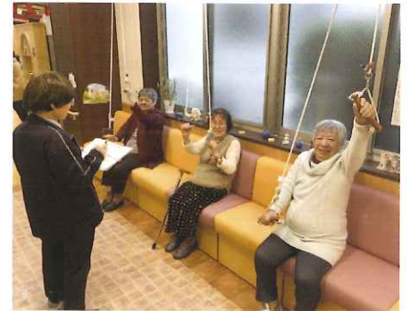
新たに機能訓練係を設定する等利用者にかかわる時間が増えました。