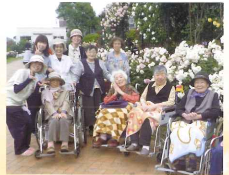
日替わりレクや多くのボランティアさんに活動していただいています。